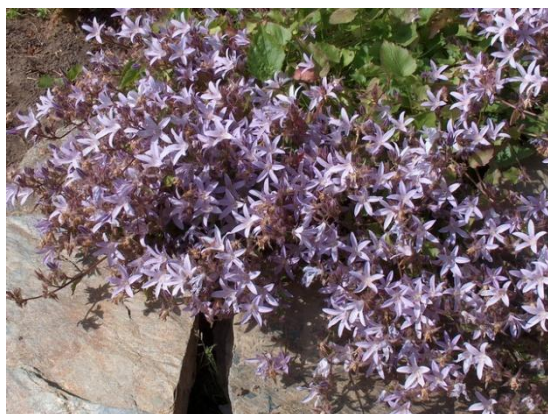
Campanula poscharskyana 'Lilacina'