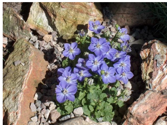
Campanula 'Mai Blyth'