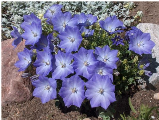
Campanula carpatica 'Blaumeise'